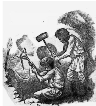
Рис. 25. Работа киркой и каменным молотом.