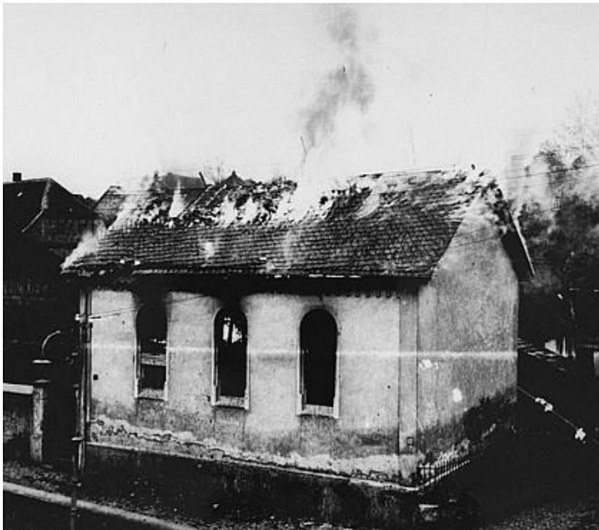
Синагога в Оберрамштадте (город в юго-западной части Германии), горящая во время "Хрустальной ночи" ("Ночи разбитых витрин"). Оберрамштадт, Германия, 9-10 ноября 1938 года.